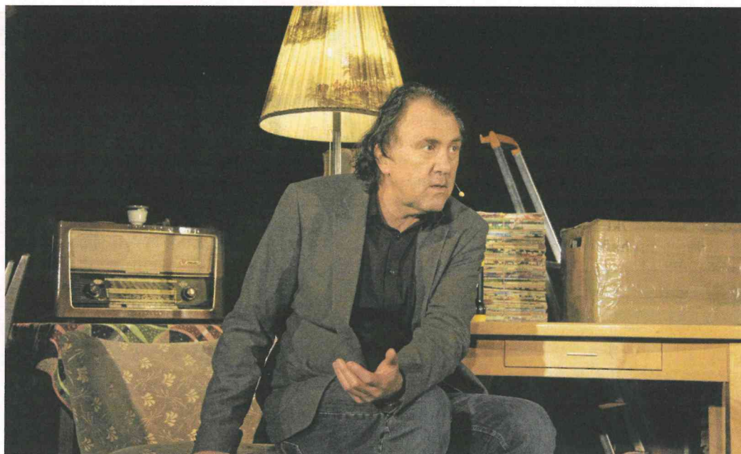
Der österreichische Kabarettist plauderte über die großen Themen des Lebens.